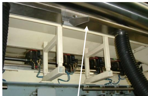
Individuelle Konstruktion des unteren Absaugkopfes unter Berücksichtigung der Trimbehälter

Absaugkopf Mit Wegschwenk Und Höhenjustierung nach QS