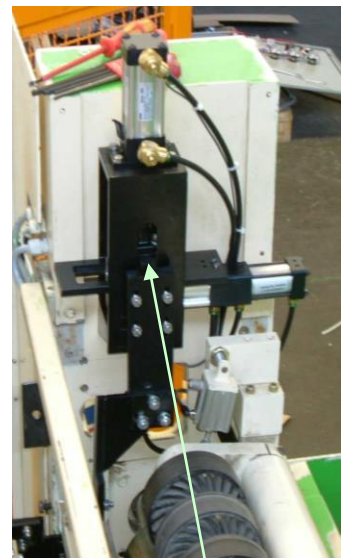
Wegschwenkvorrichtung bei Auftragswechsel